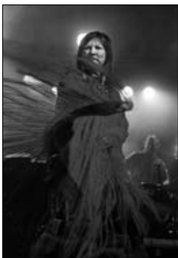
KOMMER Mari Boine

– Tungtvann har vært så mange ganger på Karlsøya at de begynner å bli husvarme, sier han og forteller at duoen i år tar med seg Jaa9 og OnkIP.