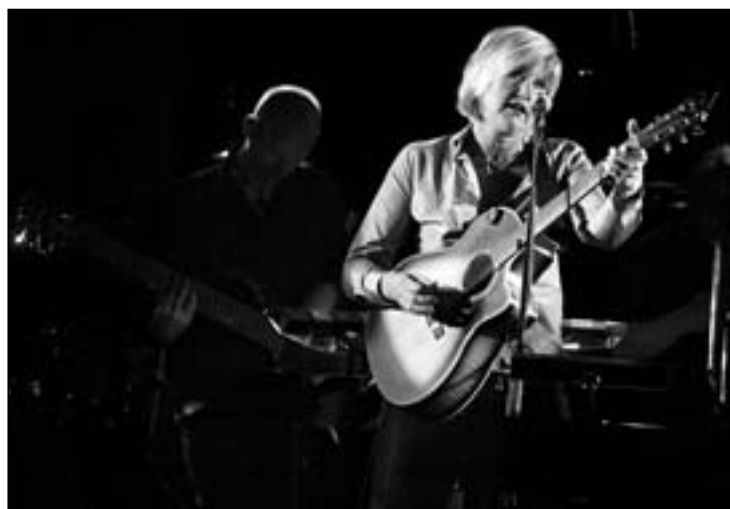
KOMMER Anne Grete Preus

– Tungtvann har vært så mange ganger på Karlsøya at de begynner å bli husvarme, sier han og forteller at duoen i år tar med seg Jaa9 og OnkIP.