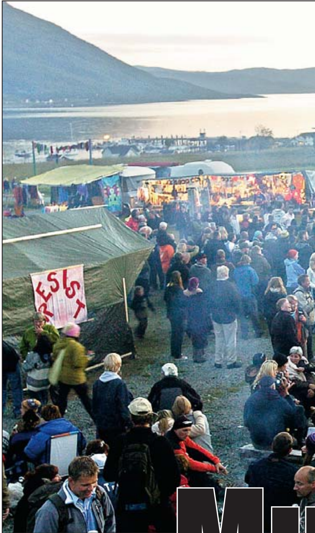
SCENELIV: Mikael Wiehe fester grepet om festivalpublikum foran scenen på Karlsøya.