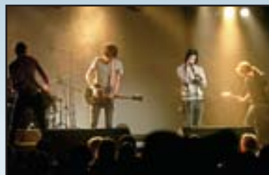
ØYA OG URØRT: Tromsøgruppa Box of Mothers seiler i medvind for tiden. Denne uka på Urørt, i august på Øyafestivalen. Bildet er fra støttekonserten for Tromsøs vennskapsby Gaza på Rica i fjor.