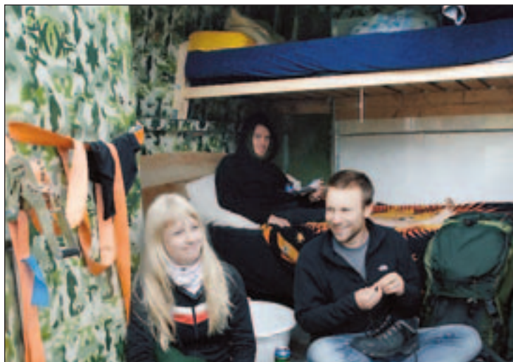
INNREDNING: Bak i bussen er det innredet flere senger, og i løpet av noen dager skal de bygge eget kjøkken ombord.

– Det er en veldig fin atmosfære. Øya er liten og man møter folk igjen, og tar en øl her og der. Når man vandrer litt her, skjønner man at dette er et gammelt sted som har hatt en sterk stilling.