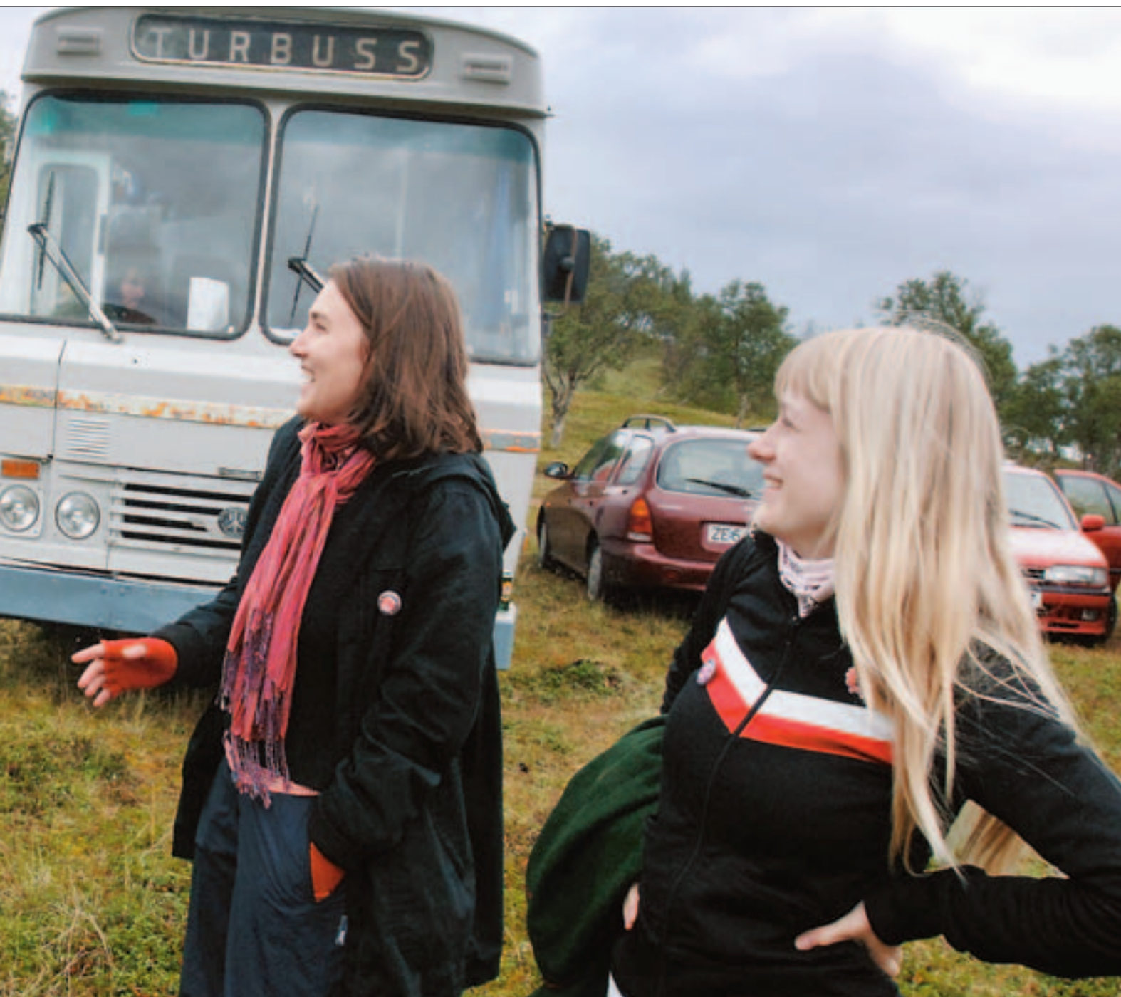
kursen mot Katmandu i egen buss.

– Jeg liker livet her. Det er trivelig på Karlsøy, og så ligger det på ei øy. Da finner jeg roen, jeg vet at jeg ikke kommer meg herfra før på søndag.