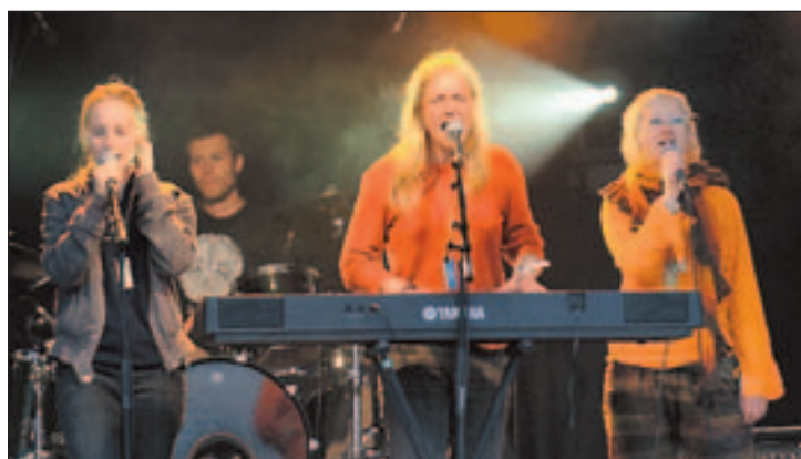
KONSERT: Fredag kveld gikk startskuddet for konsertprogrammet under Karlsøyfestivalen. Her er Big Woman Cheerleaders i aksjon.