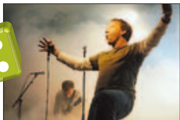
The Replaceable Heads