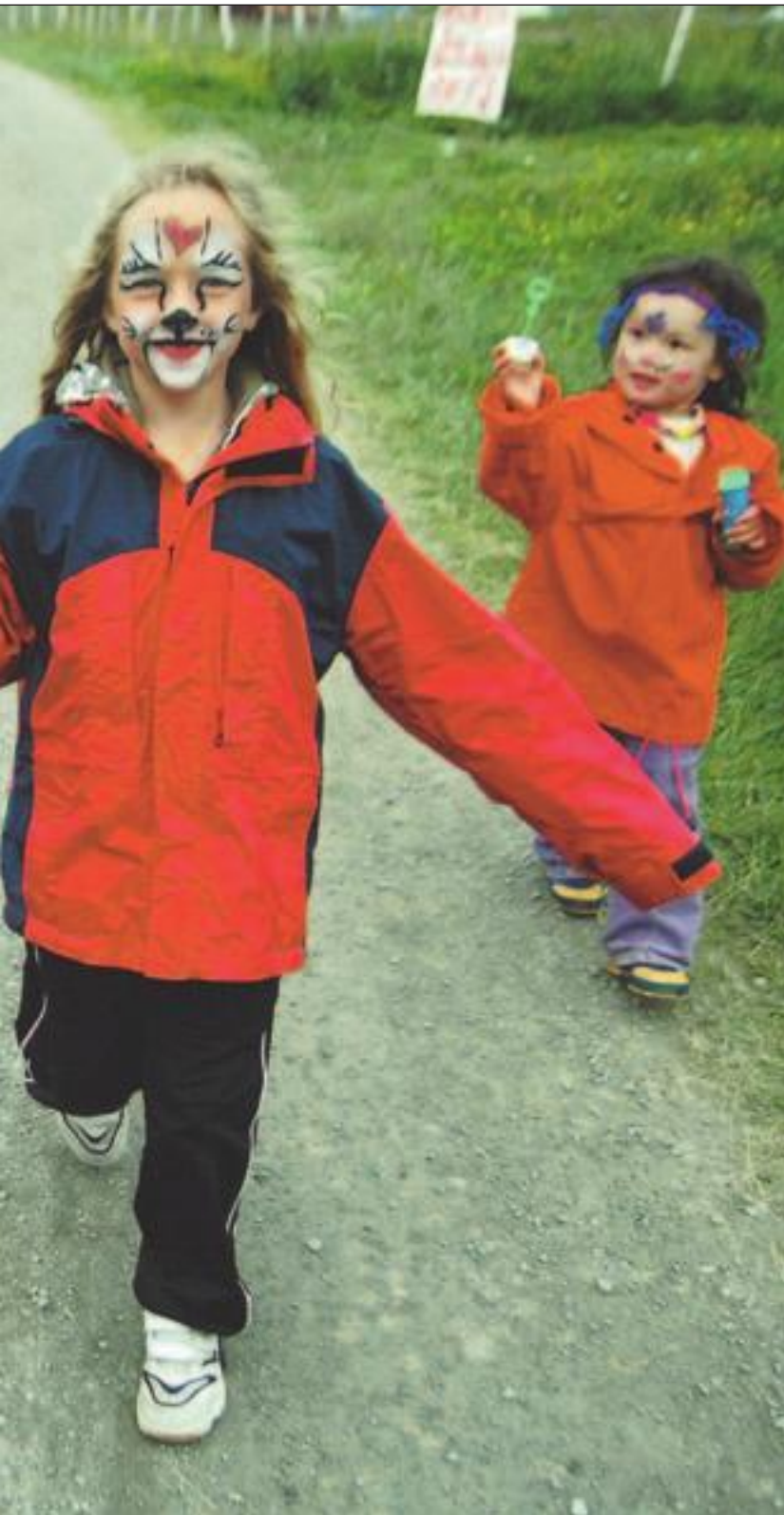
ønske folk velkommen. Desverre kom ikke ferga når den skulle.