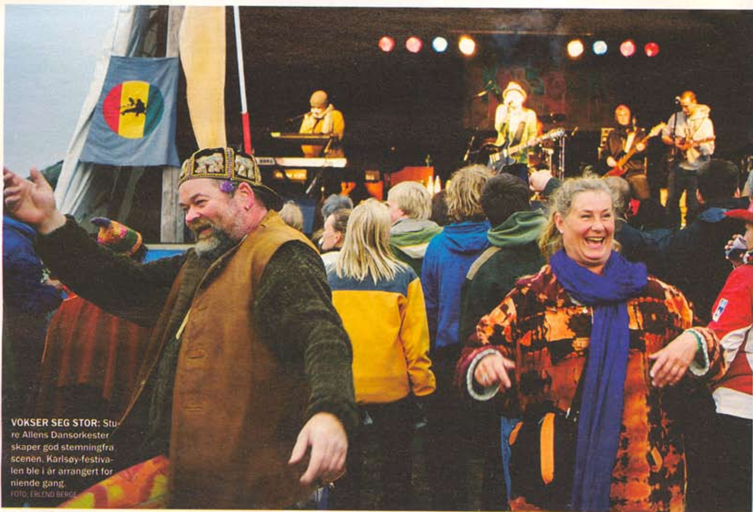
VOKSER SEG STOR: Sture Allens Dansorkester skaper god stemning fra scenen. Karlsøy-festivalen ble i år arrangert for niende gang.

inspirert av 1968-opprøret i USA var kollektivene et opprør mot livsstilene i resten av samfunnet. Forestillingen om at verden kunne gjøres til et bedre sted stod sterkt. Med et liv i pakt med naturen og sjelen var utopien mulig. Motkulturen slo rot på Karlsøy.