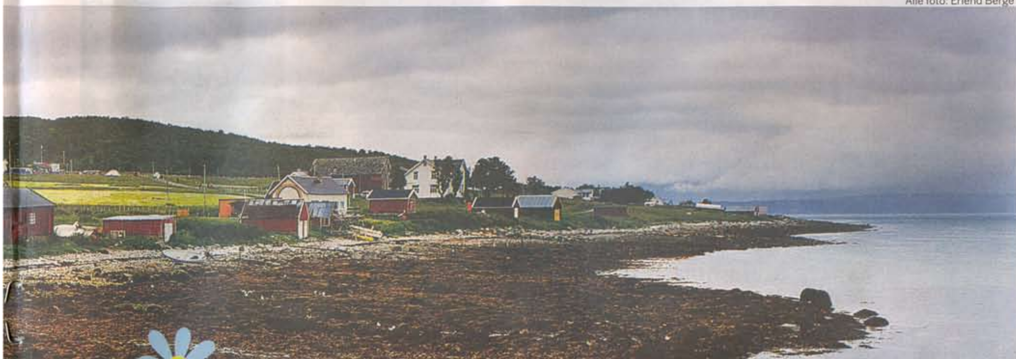
SMÅTT: På 1970-tallet flyttet mange hippier til Karlsøy. Nå bor 25 mennesker fast på øya.