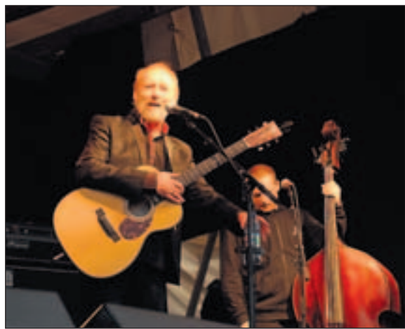
FAVORITT: Både voksne, barn og ungdommer hadde møtt opp for å oppleve Halvdan Sivertsens konsert.

– Det blir mye kjent og kjært i kveld. Vi har ikke satt opp setlista ennå, men det blir nok mye gammelt. Jeg har en del nye sanger, men vi ser an stemningen for hvorvidt vi spiller dem.