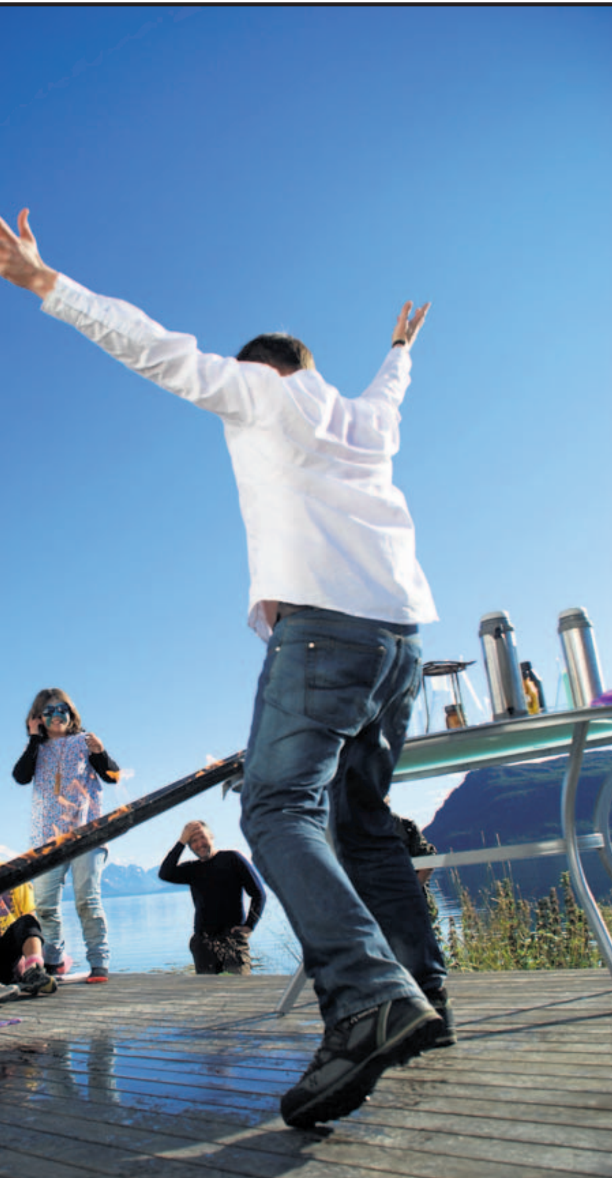
iment med en takrenne, flammer og en ballong. – Nesten sånn var det når Newton fikk en idé. Da sa det pang!